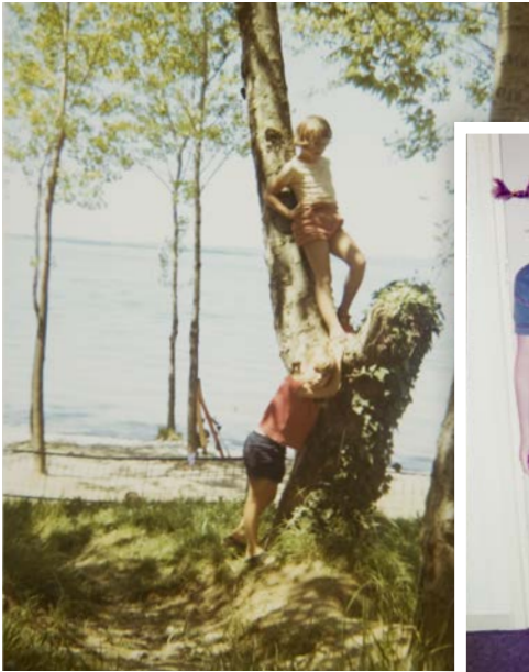
Als Pippi Langkous