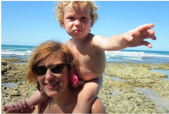
↑ Costa Rica ↓