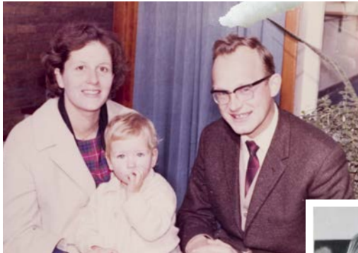
nog in ochten