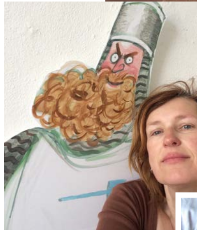
↑ Ridder in atelier Utrecht