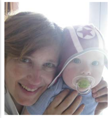
mijn lieve kind