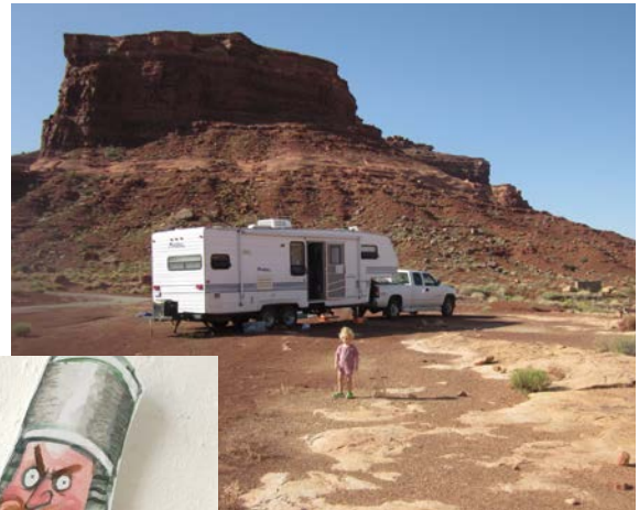
Michigan ↑ USA ↓ Utah