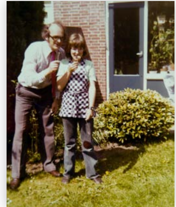
In de tuin in Maartensdijk