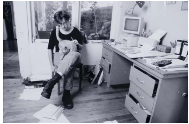
Alleen & aan het werk